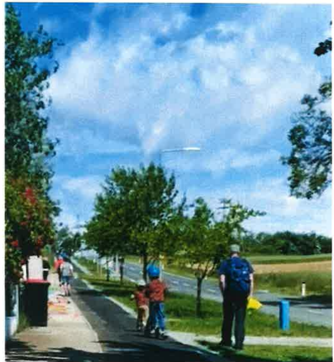
Der bestehende Radweg vom Ort in die Neue Siedlung soll bis nach Neufeld weitergeführt werden.

Der bestehende Radweg soll als Rad- und Gehweg bis Neufeld weitergeführt werden. Die Pläne liegen bereits vor und sollen gemeinsam mit verkehrsberuhigenden Maßnahmen entlang der Landesstraße in der Neuen Siedlung umgesetzt werden. Dieser Rad- und Gehweg stellt eine Verbindung mit dem Radnetz des Landes, aber auch eine Anbindung an den Bahnhof Neufeld dar. Wir hoffen auf eine positive Bewertung seitens der Mobilitätszentrale und des Landes und werden bei Neuigkeiten sofort berichten.