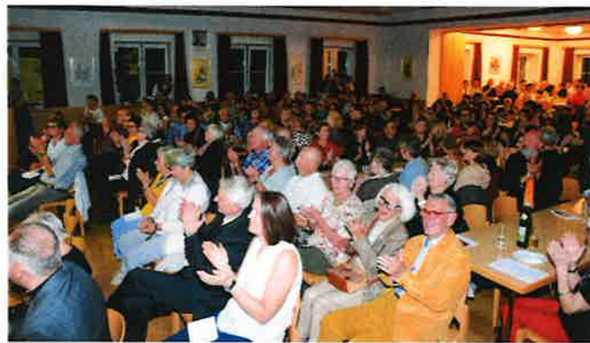
... und begeisterte das Publikum.