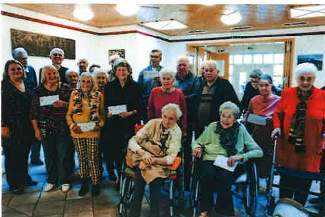
Die Jubilar*innen, die 2020-2022 ihren 85. Geburtstag feierten.