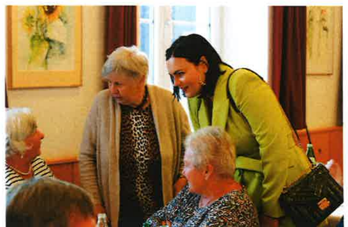
Landeshauptmann-Stellvertreterin Astrid Eisenkopf feierte mit.