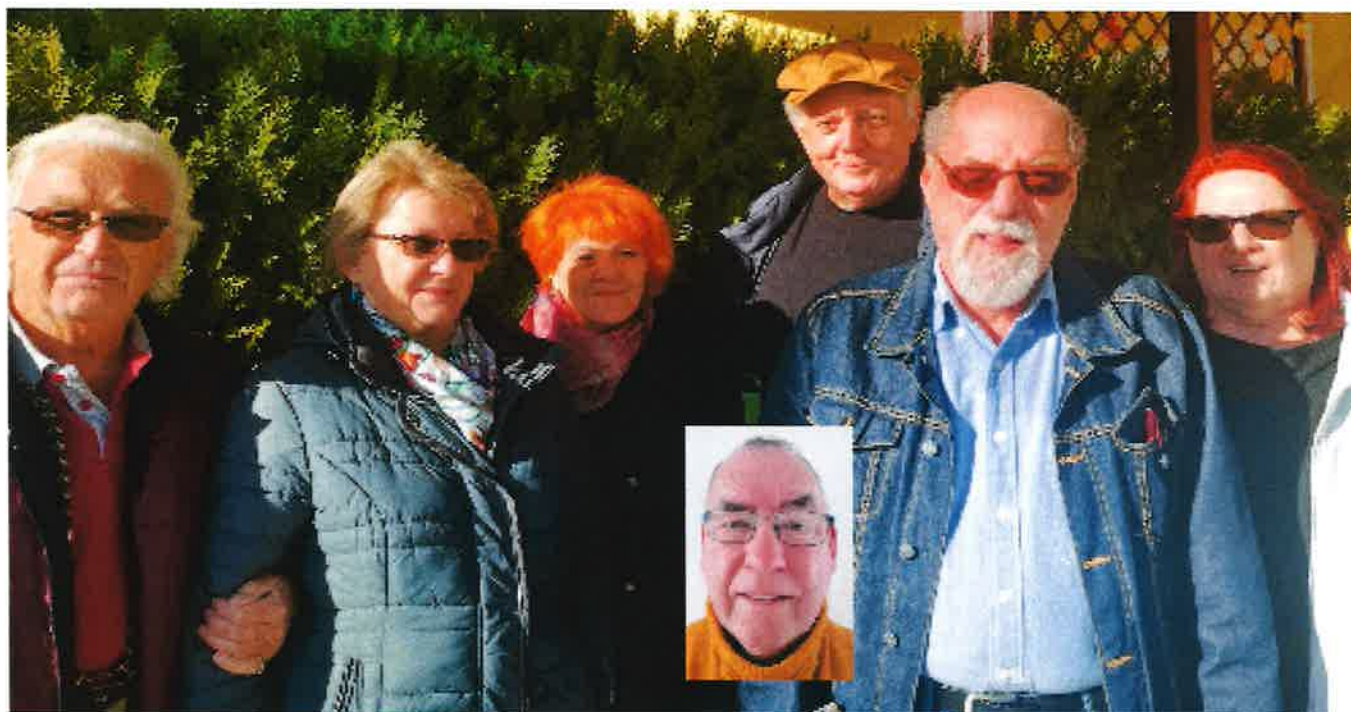
Engagiertes Team des Vereins Miteinander-Füreinander

Unser Team, das teilweise seit Jahren für uns tätig ist, ist auch in Zukunft bereit, sich für den Verein zu engagieren.