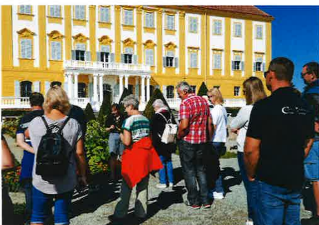
Interessante Führung durch den Barockgarten