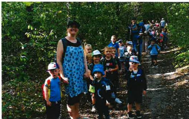
Ausflug der orangenen und blauen Gruppe zum Walderlebnispfad

Auch einige Ausflüge wurden gleich zu Beginn des Kindergartenjahres gemacht. Die Schulhüpfer der roten