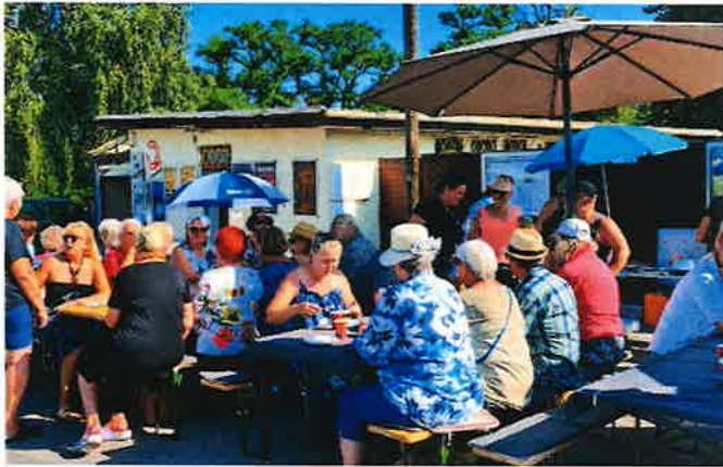
Frühstück am See

Auch am heurigen Dorrfest im Ort war unser Stand wieder ein beliebtes Ziel. Getränke, Cocktails und auch kleine Speisen sorgten für das Wohlbefinden vieler Besucher. Die Zusammenarbeit mit anderen Vereinen in Steinbrunn sehen wir als eine sehr positive Entwicklung im Sinne der Steinbrunnerinnen und Steinbrunner. Die Kooperation mit dem Pensionistenverband Steinbrunn bei einigen Veranstaltungen ist ein zusätzlicher Gewinn für die Gemeinde.