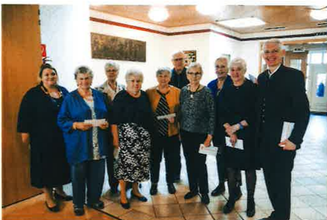
Die Jubilar*innen, die in den Jahren 2023 ihren 80. Geburtstag feierten.