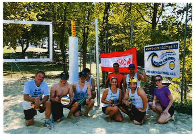
King and Queen Turnier am Steinbrunner See