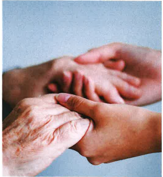
Der Pflegestützpunkt soll möglichst zentrumsnah errichtet werden.

Gleich nach Bekanntwerden der leider negativen Verhandlungsergebnisse wurde die Gemeinde tätig, neue Standorte wurden gesucht und gefunden und Erstgespräche bereits geführt. Augenblicklich steht das Land erneut mit Grundstücksbesitzer*innen in Kontakt, um die notwendigen Grundstücke zu erwerben. Wir hoffen auf die Unterstützung der Grundstücksbesitzer*innen, denn die Versorgung unserer älteren Bevölkerung durch einen Pflegestützpunkt, zusätzlich zum bestehenden Pflegeheim, wäre eine große Bereicherung für unsere Gemeinde.