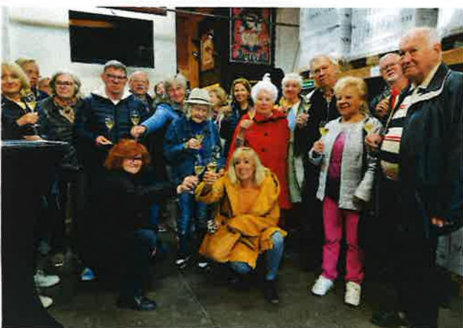
Ausflug in die Sektkellerei Szigeti in Gols