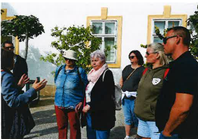
Die Mitglieder lauschten den Erläuterungen