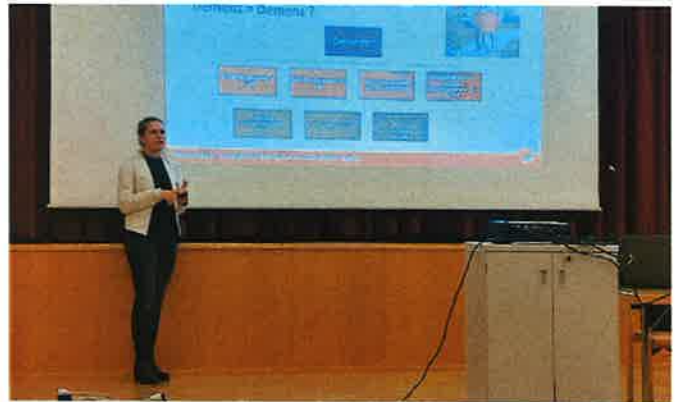
Vortrag zum Thema "Demenz"