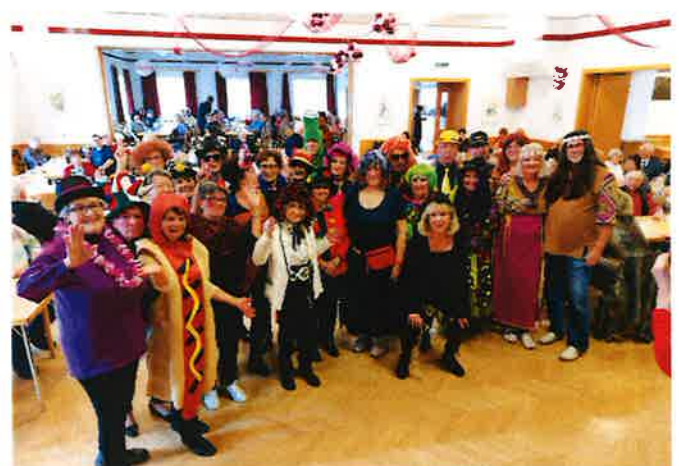
Faschingsfest am Rosenmontag 2023