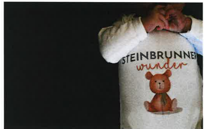
19 Steinbrunner Wunder erblickten im heurigen Jahr das Licht der Welt.