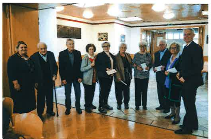
Die Jubilar*innen, die in den Jahren 2023 ihren 85. und 90. Geburtstag feierten,