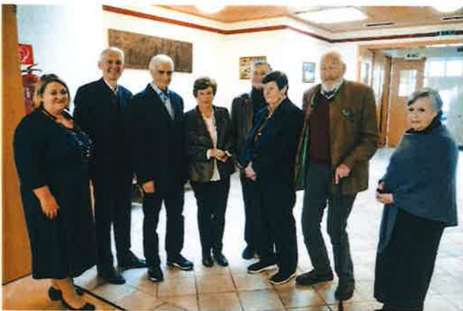
Steinbrunner Ehepaare feierten ihre diamantene Hochzeit (60 Jahre).