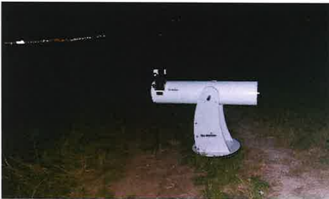
Bei der Mondwanderung kamen Teleskope zum Einsatz.