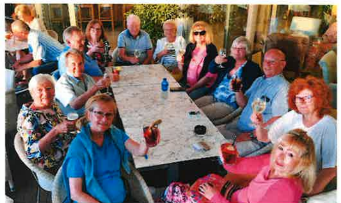
Frühjahrestreffen 2023 in Ibiza