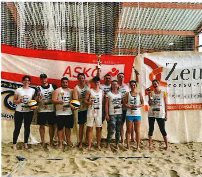
King and Queen Turnier in der Halle

In der kalten Jahreszeit trainieren wir jeden Sonntag in der Beachhalle in Rannersdorf und freuen uns schon auf den nächsten Sommer.