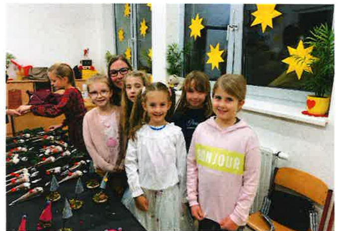
Adventbazar im November 2023

Auch unsere jüngste Schulveranstaltung, der Adventbazar unserer Schule, war gut besucht. Die liebevoll gestalteten Basteleien der Schulkinder und die von Eltern und Schulpersonal angefertigten Adventkränze konnten von den Besucher*innen erworben werden.