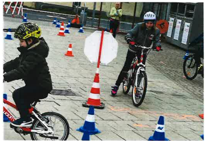
Radworkshop am Friedrich Robak-Platz

Schließlich feierten wir unser Schulschlussfest, das - wie wir es gewohnt sind - sehr gut besucht war! Im Turnsaal durfte sich jede Klasse mit einem Lied oder Tanz präsentieren. Das Fest wurde abgerundet mit der Aufführung des zweisprachigen Musicals „Hrvatska ljubav 2.0“, bei dem nicht nur die Kinder ihr schauspielerisches und gesangliches Talent zeigen konnten, sondern auch einige Lehrkräfte!