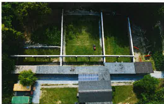
Drohnenaufnahme der renovierten FFW-Anlage

Unser Schießsportstadion erinnert kaum mehr an die ehemalige Fundstätte langobardischer Grabbeigaben wie ein Hiebschwert Typ Spatha und einen extrem seltenen Spangenhelm Typ Baldenheim. Offenbar hatte das Gelände schon früh Bezug zu Waffen.