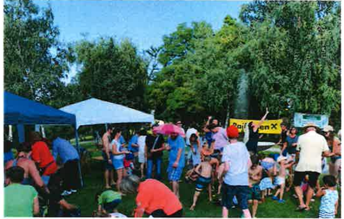
Das Sommerfest wurde von dem Pensionistenverband, dem Verein Freizeitanlage Steinbrunnersee, dem Siedlerverein Steinbrunn und den Kinderfreunden veranstaltet.

Grünschnittabholung im Herbst, eine Vereinszeitung, unsere Homepage und eine Facebook-Gruppe mit über 500 Gruppenmitgliedern für schnelle Informationen. Beliebt ist auch unsere Gartenbörse in Form einer WhatsApp-Gruppe.