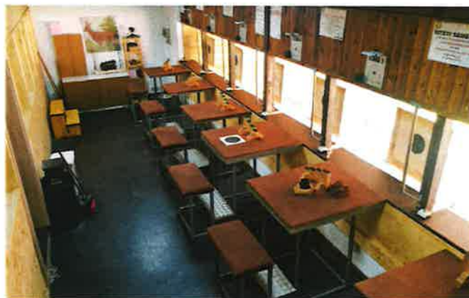
Der modernisierte und nun auch großkalibertaugliche 100m Langwaffenstand

In der kalten Jahreszeit wird im Schützenhaus im Ort, dem „Luftheim“, mit Luftpistole und Luftgewehr trainiert und burgenländische Vereine duellieren sich bei den Rundenwettkämpfen.