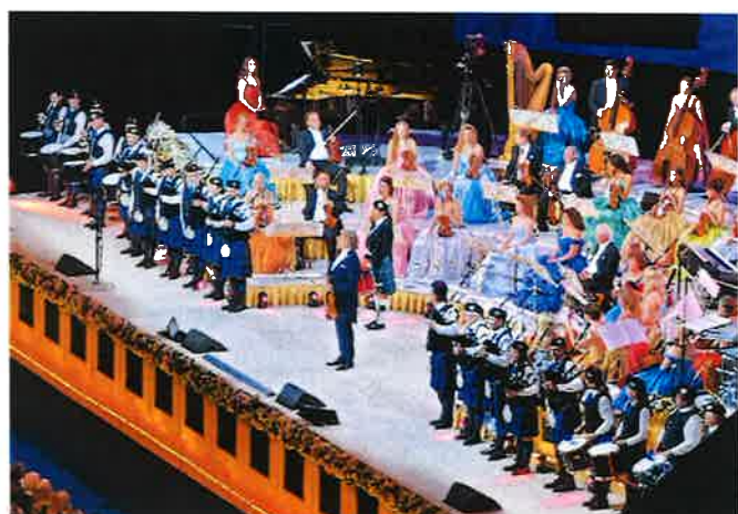
Konzertauftritt mit Andre Rieu, Stadthalle Wien