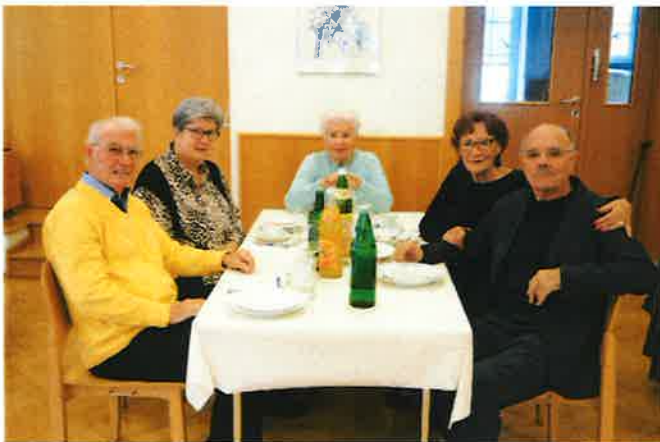
Genossen den geselligen Nachmittag