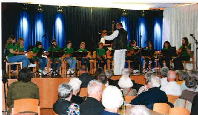
Das Herbstkonzert fand im Oktober 2023 statt...

2023. ljeta je kod nas stalo u znaku zahvale. Počeli smo novo ljeto s mašom zahvalnicom ku smo oblikovali. Tokom ljeta smo bili na gostovanju u Križevci i smo onde sudjelivali pri Križevačkom spravišću. U jeseni smo imali naš veliki koncert, ki je od publike bio dobro primljen. Pri ovoj prilici je i naš naraštaj imao svoj prvi koncert na domaćoj pozornici. Posebno nas veseli, da su svi – stari i mladi muzičari velikim angažmanom kotrigi našega društva.