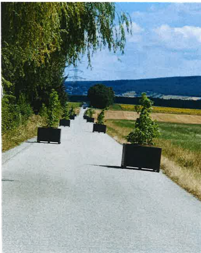
Die Baumtröge entlang der Strittfeldstraße sollen für langsames Fahren sorgen.

Auch wenn wir als Gemeinde unsere Verantwortung gerne wahrnehmen, so ersuchen wir euch alle um ein rücksichtsvolles und temporeduziertes Fahrverhalten. Wir dürfen nämlich nicht vergessen, dass oftmals wir selbst es sind, die viel zu schnell unterwegs sind.