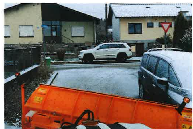
Die Schneeräumung wird seit diesem Winter von den Außendienstmitarbeitern übernommen.