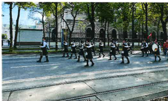
1. Mai-Aufmarsch Ringstraße, Wien