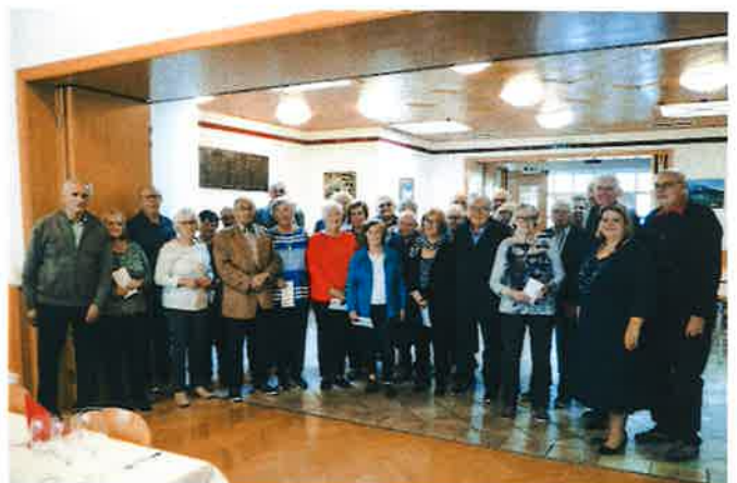
Steinbrunner Ehepaare feierten ihre goldene Hochzeit (50 Jahre).