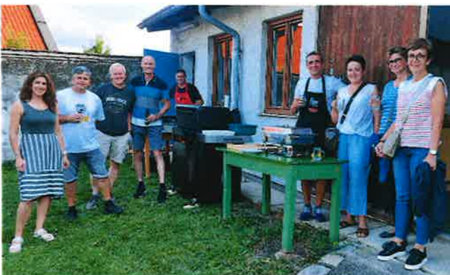
Beim 10-jährigen Jubiläum wurde der neue Gasgriller eingeweiht.

Wir blicken zuversichtlich ins neue Jahr und möchten unsere regelmäßigen Lauftreffs und das Stabilisationstraining weiterhin anbieten. Der Höhepunkt des kommenden Jahres wird der 3. Steinbrunner Ortslauf sein, bei dem wir auf viele Teilnehmer und Zuschauer hoffen.