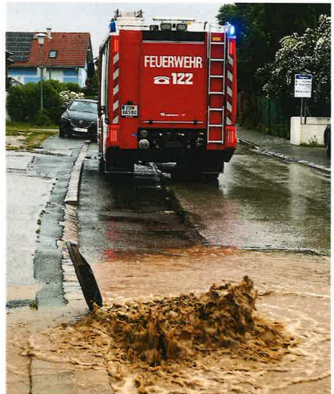
Starke Regenfälle brachten unser Kanalsystem in den letzten Jahren immer wieder an seine Grenzen und sorgten für Feuerwehreinsätze.

Das erste Konzept konnte aufgrund der fehlenden Zustimmung der Grundstückseigentümer*innen nicht umgesetzt werden. Ein neues Konzept wurde inzwischen erstellt. Augenblicklich führen wir letzte Gespräche, die uns zeigen werden, ob wir die Errichtung des notwendigen Hangwasserbeckens innerhalb des nächsten Jahres umsetzen werden können oder das Projekt verschoben werden muss.