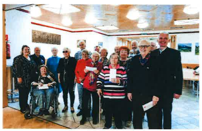
Die Jubilar*innen, die 2020-2022 ihren 80. und 85. Geburtstag feierten.