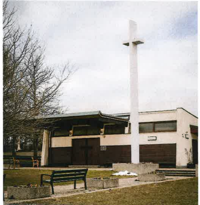
Unsere Leichenhalle wurde im Jahr 1969 errichtet und ist sanierungsbedürftig. Auch die Grünflächen rund herum sollen neu gestaltet werden.

Da die Leichenhalle ein historisches Gebäude im Stil des Brutalismus ist, soll dieser Charakter erhalten bleiben. Dennoch braucht es deutlich mehr Platz und eine zeitgemäße Räumlichkeit, die würdige Verabschiedungen ermöglicht. Wir halten euch auf dem Laufenden!