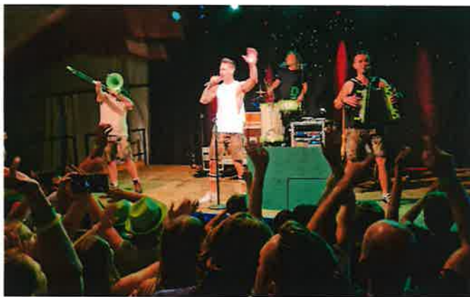
Die Draufgänger beim diesjährigen Sportfest im August

Besonders herausragend ist nicht nur die sportliche Leistung, sondern auch das kulinarische Angebot bei den Heimspielen. Die Gäste können sich auf gastronomische Highlights freuen, die das Fußballerlebnis zu einem rundum gelungenen Event machen.