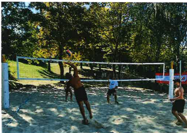
King and Queen Turnier am Steinbrunner See