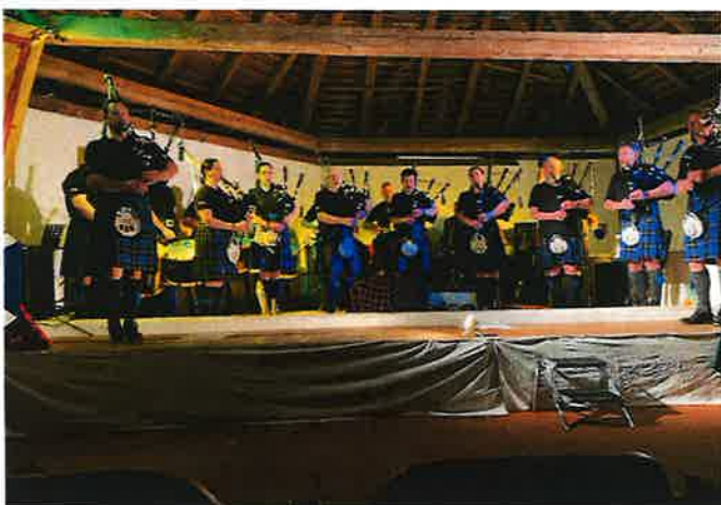
Konzert in Pötttsching