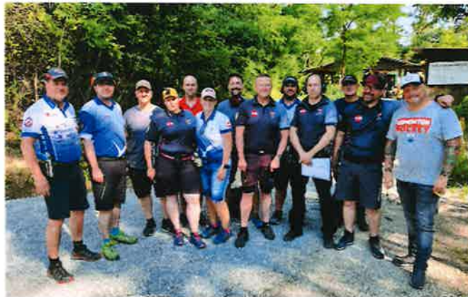
IPSC Schützen des JSSK beim Briefing vor dem Bewerb - Steinbrunner Summer Storm

Beim legendären Osterschinkenschießen und dem Pfingst- und Herbstpreisschießen dürfen wir bis zu 200 Schützen begrüßen. Selbst Landesmeisterschaften für IPSC und in den Wurfscheibendisziplinen werden auf den adaptierten Anlagen austragen, bei denen unsere burgenländische Sportschützenelite um Edelmetall kämpft.