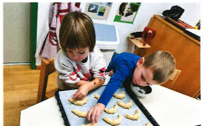
Die Kinder der grünen Gruppe bei der Vorbereitung der gemeinsamen Jause.

Wir wurden in diesem Jahr von der Gemeinde mit einem neuen Konstruktionsmaterial für den Gangbereich ausgestattet. Dieses Material fanden wir so großartig, dass wir beschlossen haben, das Material aufzustocken und es mit den Kindern zu personalisieren. Jedes Kind schenkt somit dem Kindergarten einen Baustein, wenn es Geburtstag feiert.