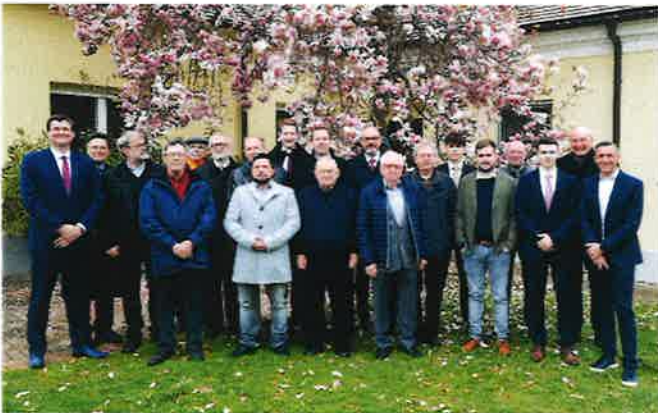
Männerchor vor der blühenden Mangolie im Pfarrhof

2023. ljetu je bilo puno aktivitetov u našaj fari, neki dogodjaji imaju jur dugoljetnu tradiciju. Spomenuti kanimo na svaki način jačenje „Muke Kristuševe“ na Macicnu nedilju. Uz brojne fešte i sastanke za dicu i odrasćene nam se je ljetos ugodalo, da prezentiramo novi logo naše fare. Ovo kaže našu farsku crkvu kot najjači simbol naše zajednice. U logo-u se po sebi razumljivo zrcali i dvojezičnost naše fare ku kanimo i u budućnosti obdržati.