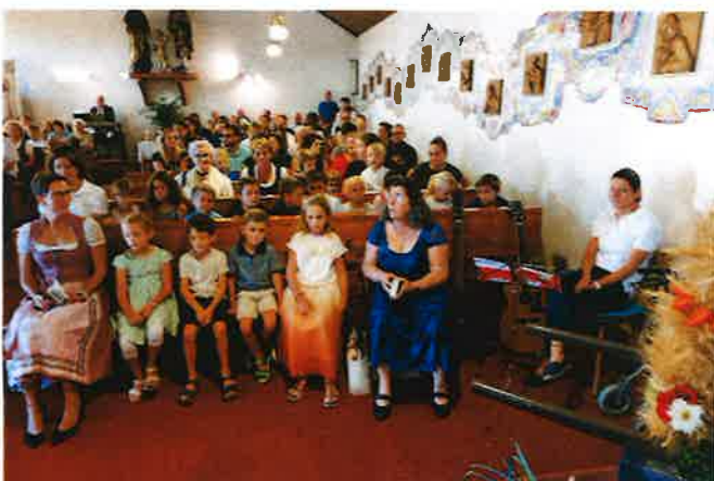
Erntedankfest – Heilige Messe in der Kapelle