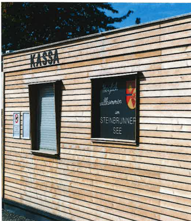
Das neue Kassenhäuschen am See wurde mit Holz verkleidet.

Die geplanten Maßnahmen am Steinbrunner See sind vielfältig und werden Schritt für Schritt anhand des vorhandenen Konzepts umgesetzt.