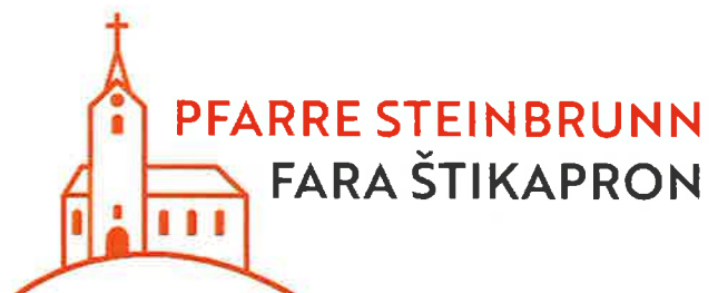
Das neue Pfarrlogo