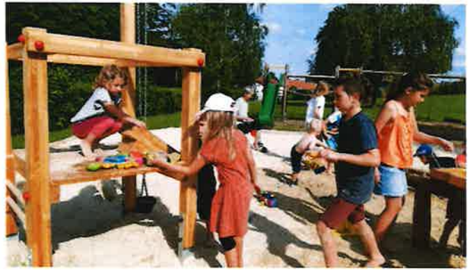
Generationennachmittag am Spielplatz