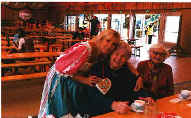
Wiener Wiesn im Prater

Wir freuen uns jetzt schon auf neue Mitglieder jeder Altersgruppe!