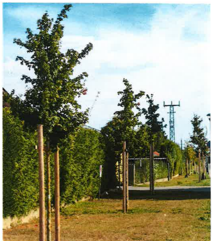
Entlang der Steinbrunner Straße wurde eine Baumallee gepflanzt.