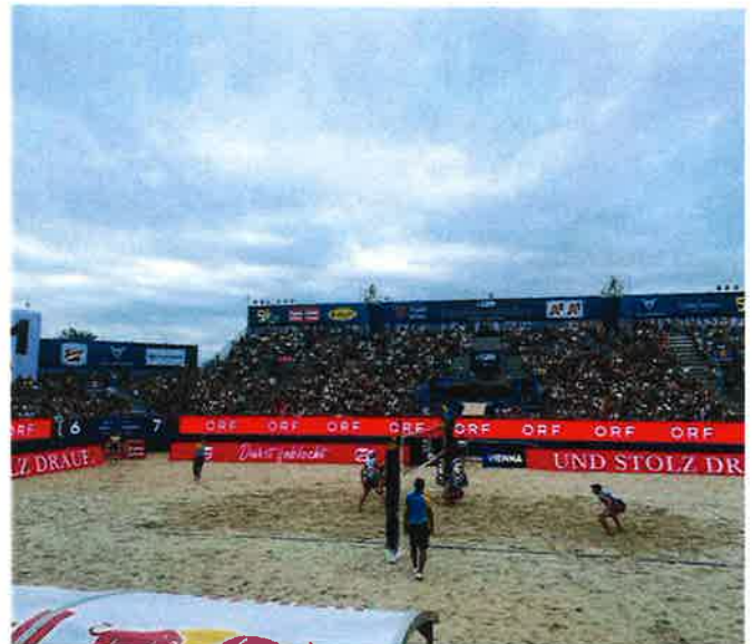
Beachvolleyball-EM in Wien