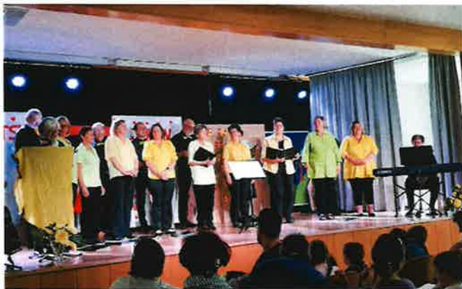
Unser Frühlingskonzert unter dem Motto „Lieben und Lachen“

Beim Frühlingskonzert unter dem Motto „Lieben und Lachen“ füllten wir das Gemeinschaftshaus mit Ohrwürmern und netten Anekdoten, die die Zuhörer*innen schmunzeln und mitschunkeln ließen. Besonderes Highlight dieses Konzertes waren die