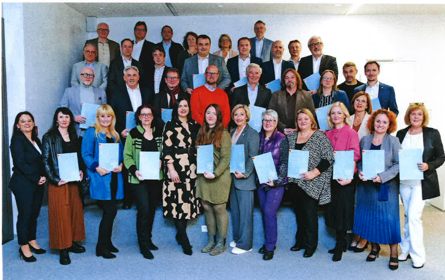
Die Bürgermeister*innen und Vizebürgermeister*innen bei der Zertifikatsverleihung.