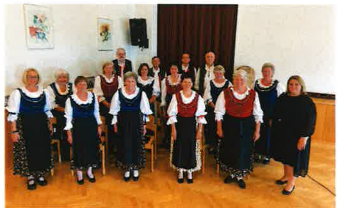
Wir umrahmten den Festakt bei der Chronikpräsentation.

Unsere Weihnachtskonzerte runden das Chorjahr ab und wir planen schon eifrig die musikalischen Highlights des Jahres 2024. Wer Lust aufs Singen hat, ist gerne zu unseren Proben eingeladen. (Mittwoch, 17 Uhr im Gemeinschaftshaus)