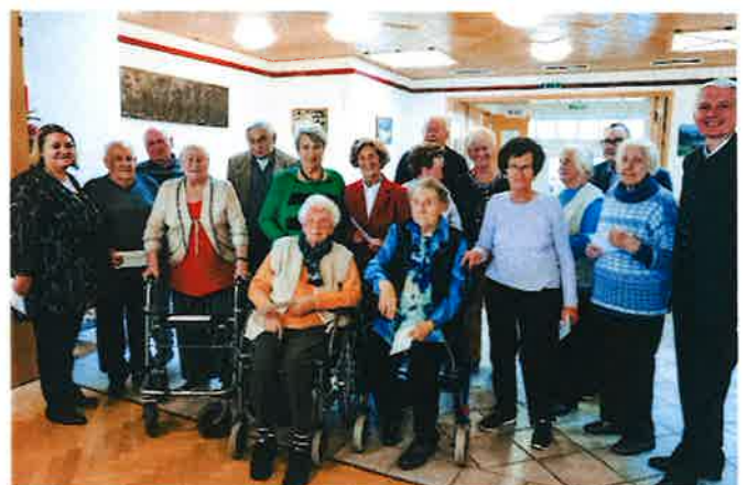
Die Jubilar*innen, die 2020-2022 ihren 90. Geburtstag feierten.