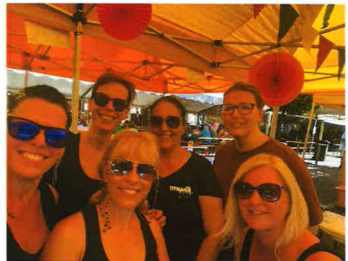
Beim Verein Dynam(f)it gab es wieder leckere Cocktails am Steinbrunner Dorffest.