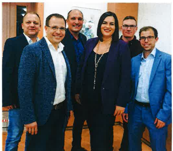
Zahlreiche Vereine, wie die Vertreter*innen des ASV Steinbrunn, gratulierten dem frisch gewählten Präsidenten.