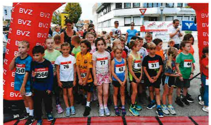
Beim 2. Steinbrunner Ortslauf starteten zahlreiche Kinder.