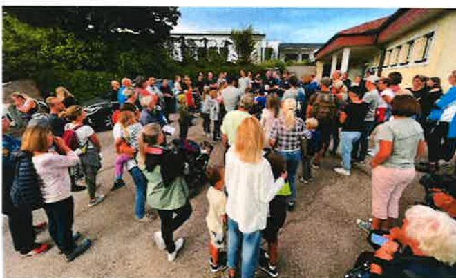
Viele Teilnehmer*innen bei der Mondwanderung 2023.

Die beachtliche Teilnehmerzahl und das überaus positive Feedback haben uns zu dem einstimmigen Beschluss geführt, solch eine Veranstaltung auch im Jahr 2024 anzubieten.