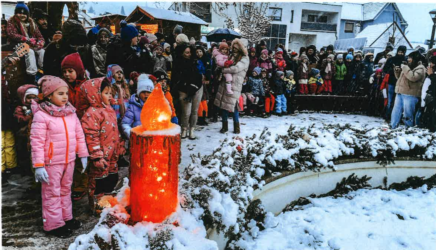
Die Kindergartenkinder sorgen für musikalische Unterhaltung bei anhaltendem Schneefall.