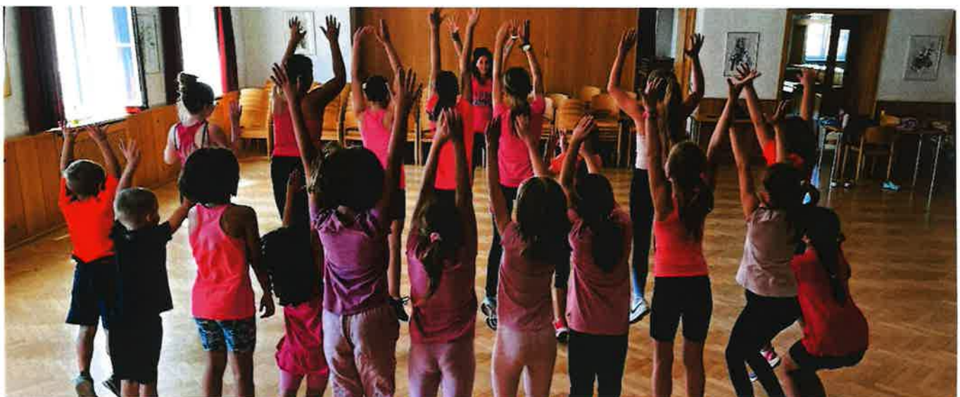
Zumba-Kids-Workshop im Gemeinschaftshaus