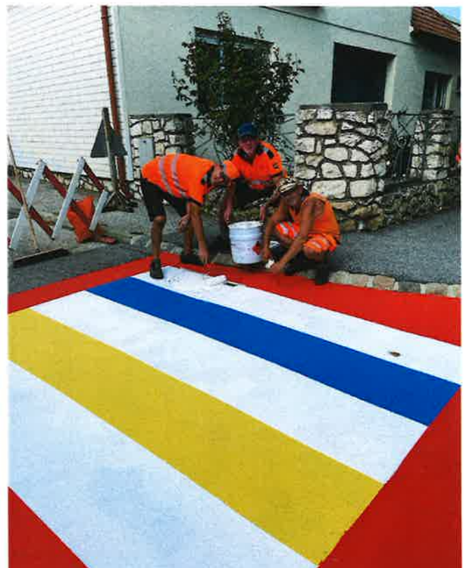
In der Bauerngasse wurde der Zebrastrifen bunt gestaltet und damit die Sichtbarkeit und Sicherheit für die Schüler*innen erhöht.